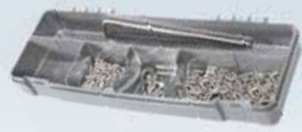
набор расходных материалов для алюминия 050020