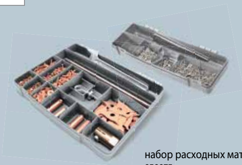
набор расходных материалов 050075